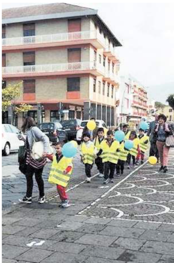
La partenza Una fase della prima «corsa» ecologica dei bambini

Il sindaco: «Riqualificare il centro storico» L'assessore: «Città a misura di bimbo e di pedone»